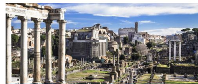
Histoire de l'Antiquité

Le département d'histoire de l'Université de Fribourg comprend quatre époques différentes à travers lesquelles les différents modules d'étude sont orientés: l'antiquité, le moyen-âge, l'histoire moderne et l'histoire contemporaine. Chacune de ces chaires offre un large éventail de cours pour chaque branche-période.