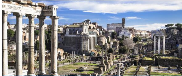
Histoire de l'Antiquité